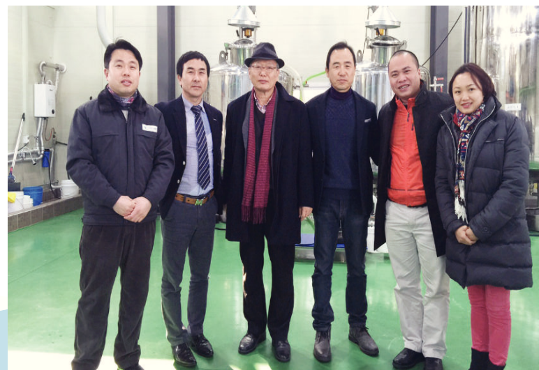
Chuyến công tác tại Hàn Quốc / Business trip in Korea