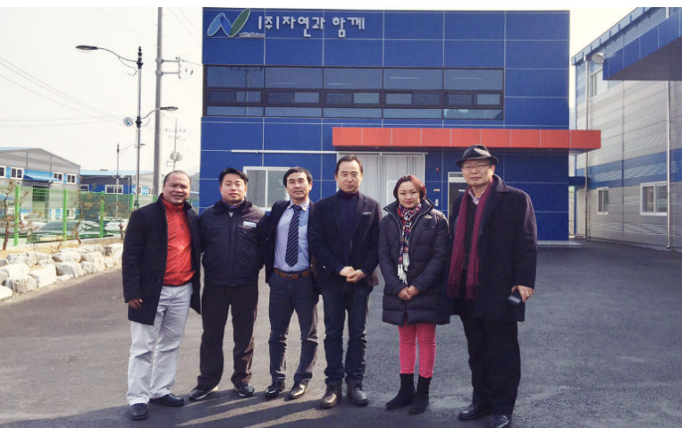
Nhà sản xuất Hàn Quốc / Korean Manufacturer