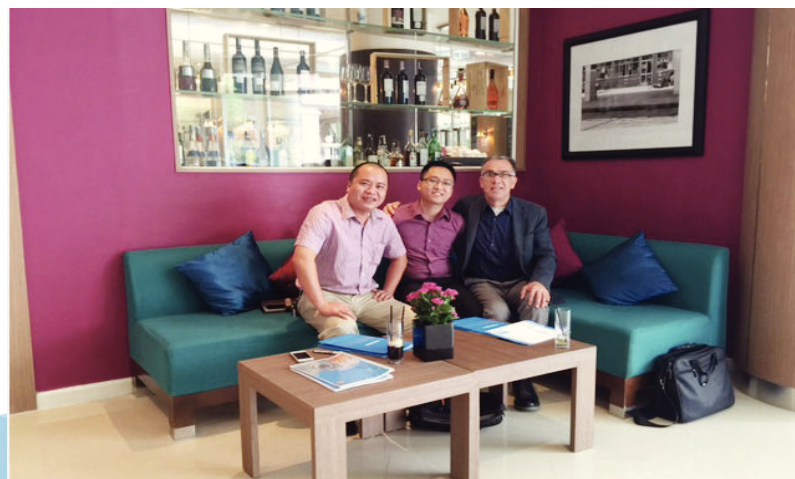
Nhà sản xuất Ý / Italian Manufacturer