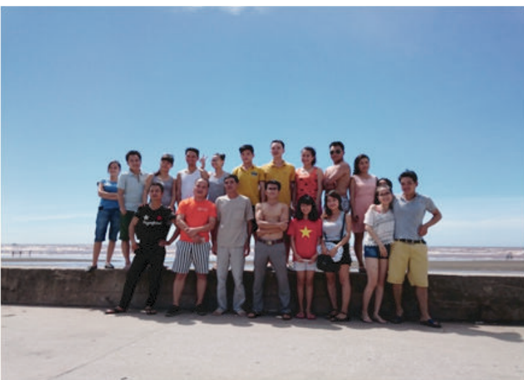
Hình ảnh hoạt động ngoại khóa của The One / Images: Outside activities of The One.

The One performs to create a professional working environment, opportunity to work and equal career development, meanwhile to raise up the capacity and passion, and finally boost up engagement of each employee. And therefore, more and more our employees should be proud of The One"